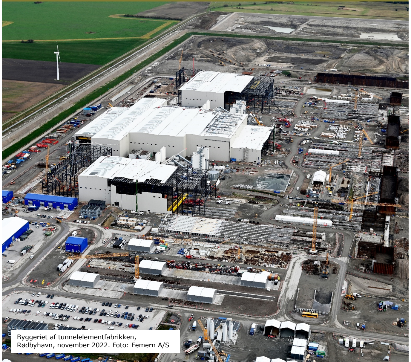
Byggeriet af tunnelementfabrikken, Rødbyhavn, november 2022.

Lolland Kommunes fokusområder, handlinger og mål