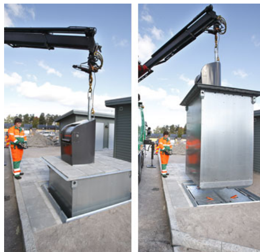
Helt nedgravede beholder