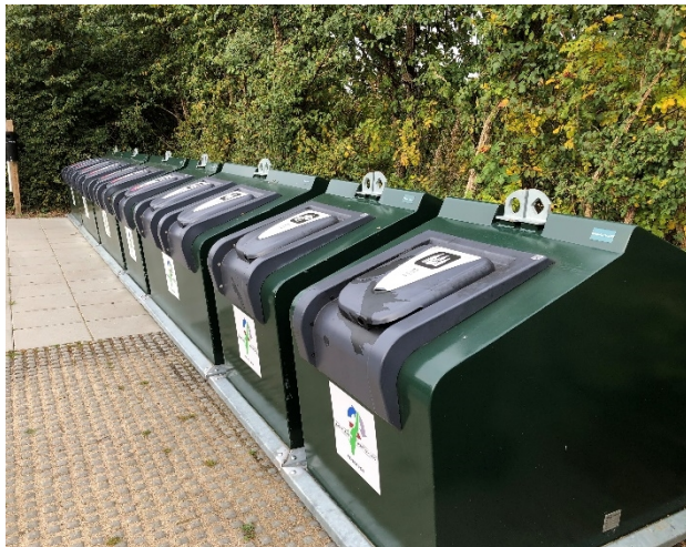
Overjordiske beholdere (flytbar)

Tømninger af disse beholdere vil være efter behov.